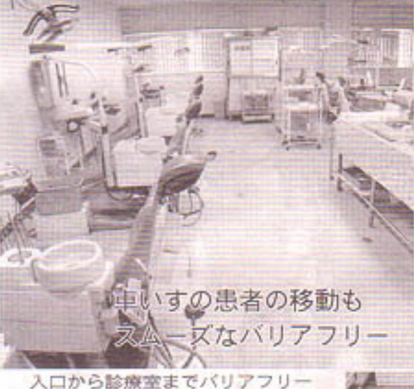
車いすの患者の移動もスムーズなバリアフリー